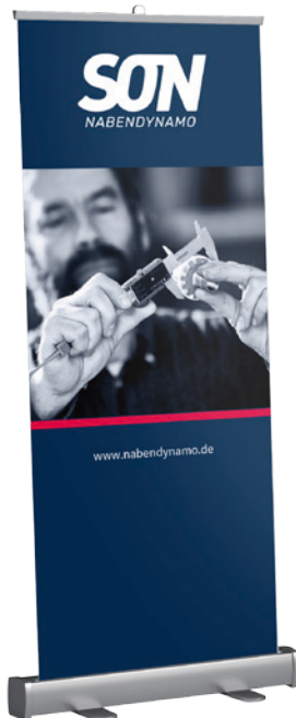
Motiv 1 Stator messen