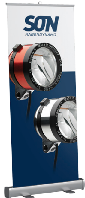
Motiv 4 Edelux II