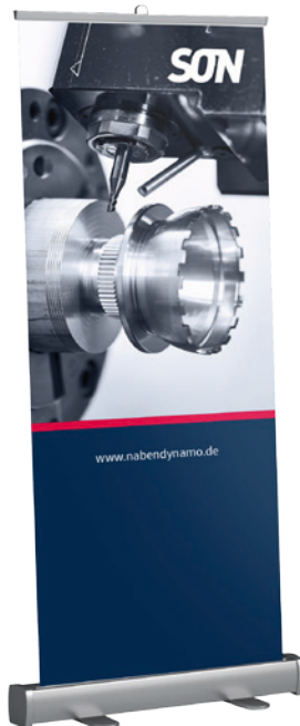
Motiv 2 Gehäuse fräsen