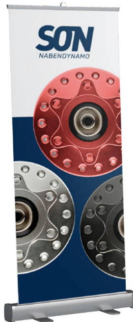
Motiv 3 Nabendynamos